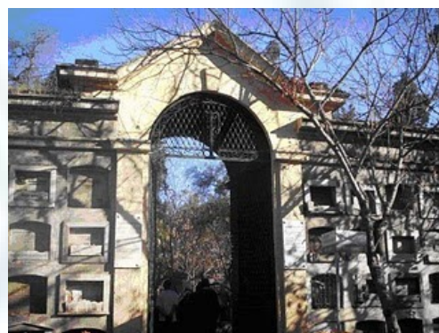
Cementerio General: Patio de los Disidentes

El Consejo de Iglesias Históricas se encuentra trabajando en el Documento-enviado por la oficina de asuntos religiosos de la presidencia-modificadorio a la ley 19.638 que establece la constitución de organizaciones religiosas, bajo la norma jurídica de derecho público. En los próximos días deberá presentarse los análisis realizados al respecto. Se ha enviado en consulta los documentos a las Congregaciones y encargado, al Comité de Estatutos de la IELCH, presentar sus observaciones.