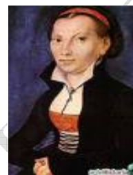
KATHARINA VON BORA